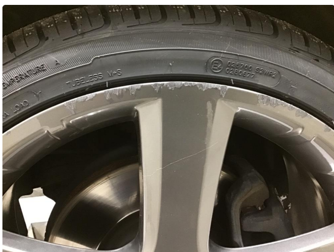
1.4 Kantkjørt felg