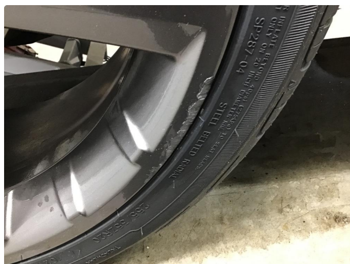
1.4 Kantkjørt felg