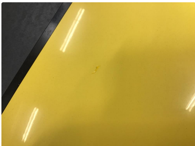
1.1 Bulk med lakkskade