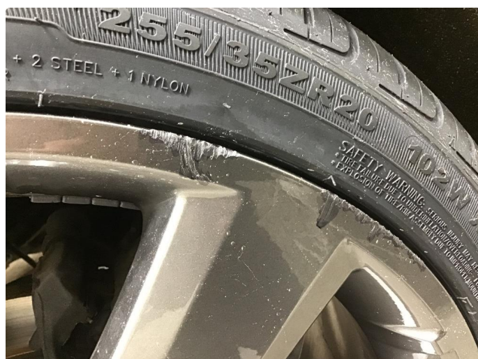
1.4 Kantkjørt felg